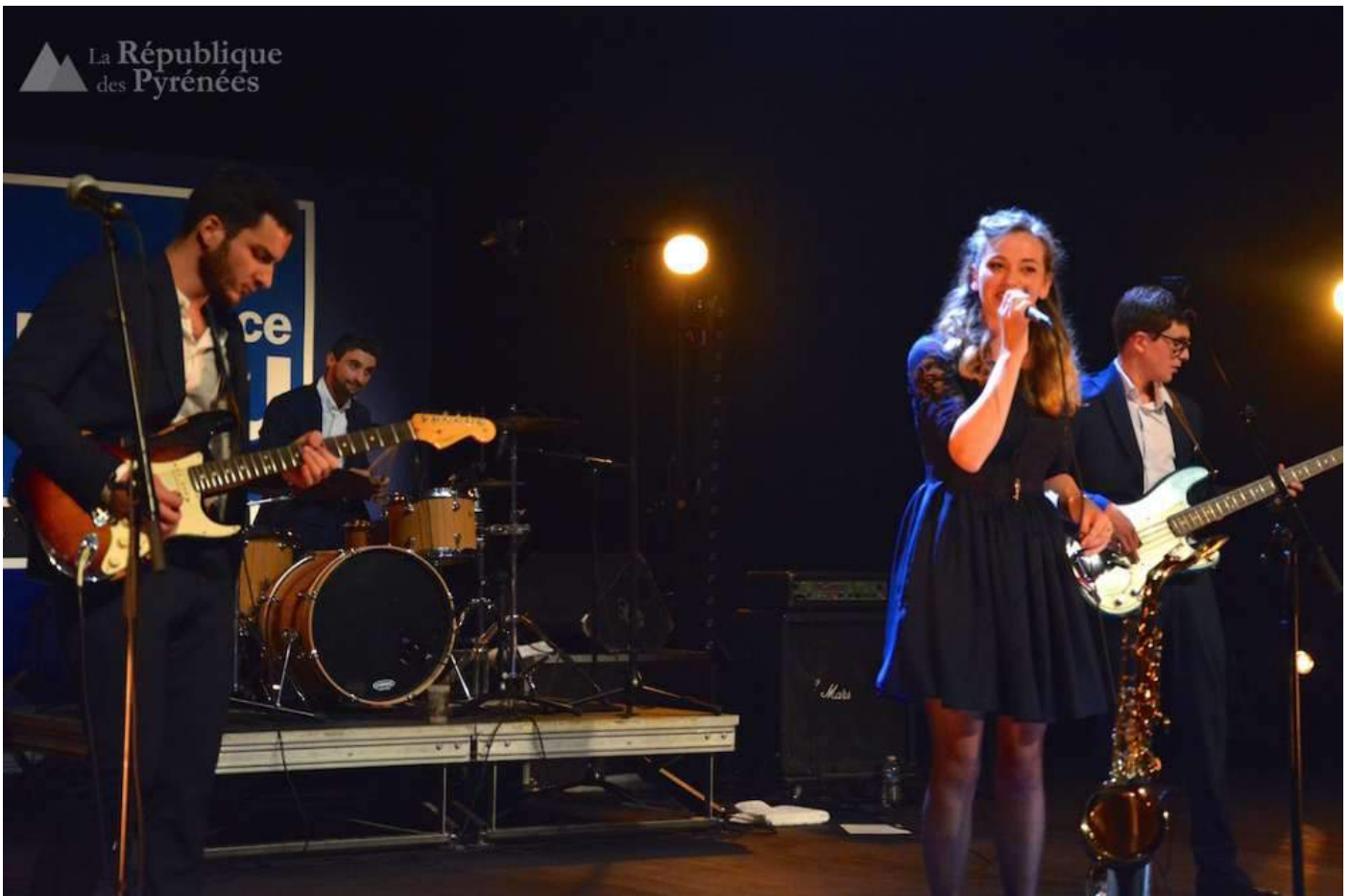
Le jeune groupe Palois Miss Bee & The Bullfrogs ont fait partager leur passion du blues avec des compositions originales et une voix superbe.

L'enregistrement du Live Aquitain de France Bleu Béarn était de retour jeudi pour la 3ème fois à l'Espace James Chambaud, avec une soirée placée sous le signe de la musique et de la solidarité au profit de la Banque Alimentaire Béarn et Soule.