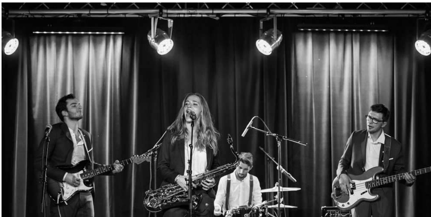
Miss Bee and the Bullfrogs, influencés par les maîtres du Chicago blues.

Publié le 23/08/2018 à 3h45 par Jean-Pierre Dupré .